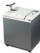
Laborautoklaven in unterschiedlichen Größen und Anwendungsbereichen