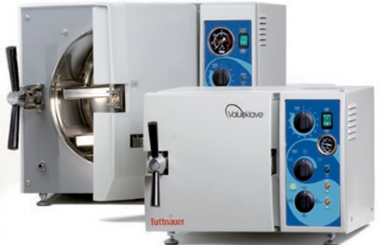
Modelle mit 7.5 Liter Kammer

Genügt den strengsten internationalen Richtlinien und Normen: