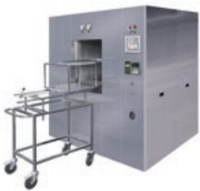
Große Sterilisatoren für Krankenhäuser und verschiedene Branchen

Tuttnauer-Angebotspalette an Reinigungs-, Desinfektions- und Sterilisationslösungen