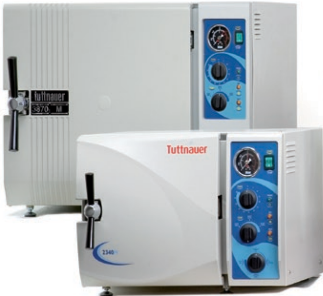
Modelle mit 19/23 Liter Kammer