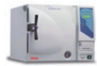
Vor- und Nachvakuum-Tischsterilisatoren für Zyklen der Klasse B