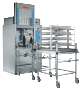
Spüler/ Thermodesinfektoren für Praxen, Krankenhäuser und Labors